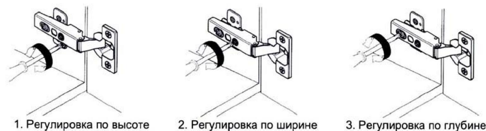
1. Регулировка по высоте